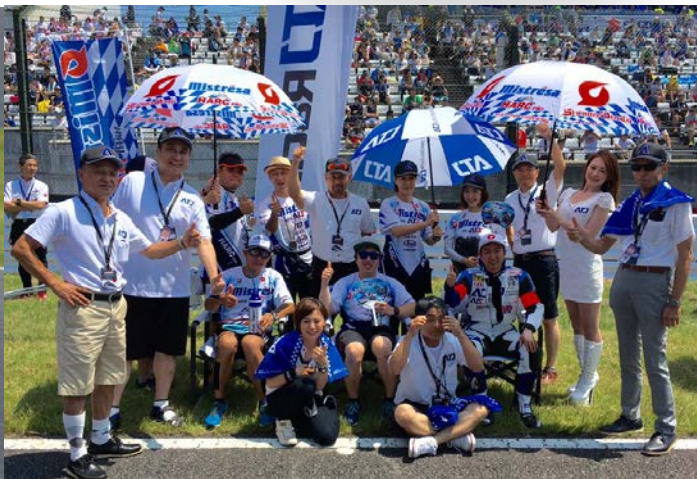
Mistresa with ATS チームメンバー