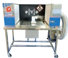
水平流テーブル型